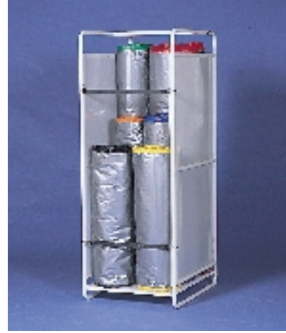
Transportvogn/Wheeled Carrier/Transportwagen Dim.: 60 x 80 x H175 cm.

Die Thermomatte von Combi-Therm ist eine effektive Lösung für die Nacht- und Wochenendabdeckung von Kühl- und Gefriermöbeln. Effektive Isolierung. Keine Kondensierung wegen des patentierten Systems. Hygienisch und leicht sauberzuhalten. Nachgewiesene Energiebesparung von bis zu 40%. Verlängert die Lebensdauer des Kompressors. Schnelles Ab- und Anmontieren. Minimaler Platzbedarf im Lager.